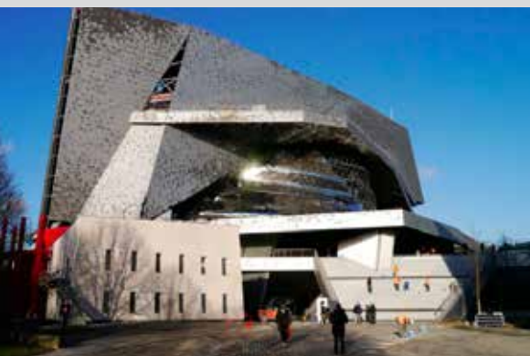
Philharmonie, Paris (France)

Ces diffuseurs conviennent pour une installation dans des systèmes de débit d'air constant ou variable, pour des pièces avec une hauteur sous plafond de 2.6 m à 4 m.