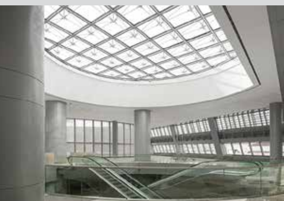
ALS installés au Krystal Kule, Istanbul (Turquie)