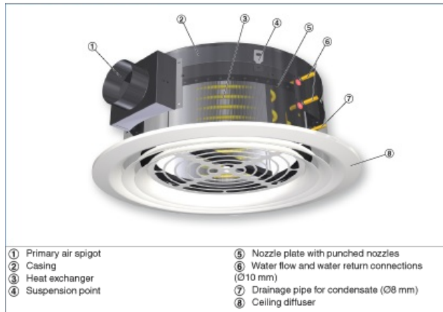
Schematic illustration of DID-R

El aire primario y el secundario se mezclan y se impulsan a la sala a través de las ranuras para impulsión de aire de manera horizontal y radial.